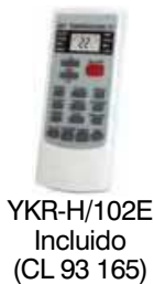
YKR-H/102E Incluido (CL 93 165)