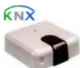
IS-IR-KNX-1i (CL 99 096)